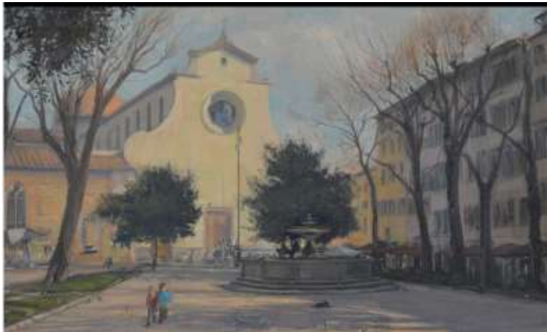
Piazza Santo Spirito / Pintura de Óleo sobre lienzo con marco / 80 x 60 cm