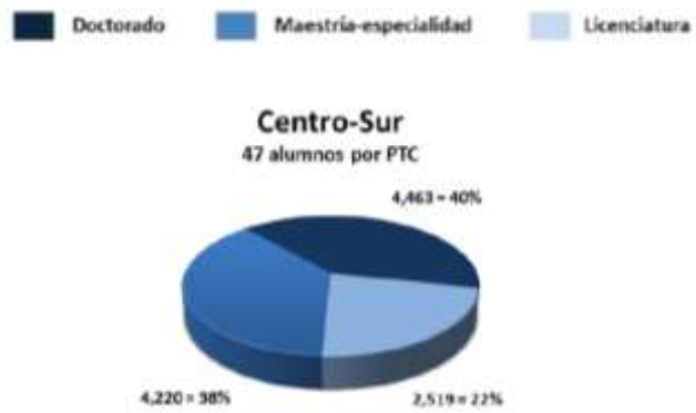
Gráfica 1.1 Personal docente de tiempo completo (PTC) de las Instituciones asociadas a la ANUIES por región y nivel de estudios. Ciclo escolar 2015-2016.

Fuente: Elaboración propia con datos de los formatos 911 de educación superior, ciclo escolar 2015-2016.